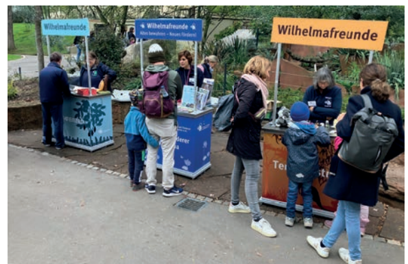
Im Einsatz am Wilhelma-Tag