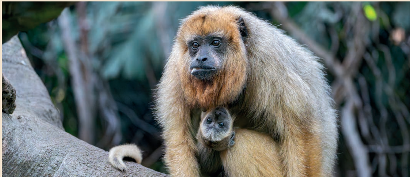
Nachwuchs bei den Schwarzen Brüllaffen

Nachdem dieses Jahr die Anlage für Amurtiger Wirklichkeit geworden ist, steht in der Wilhelma das nächste Großprojekt in den Startlöchern: die neue Elefantenwelt. Kurz vor Weihnachten 2024 hat der Landtag von Baden-Württemberg dafür 51,1 Millionen Euro freigegeben, nachdem der Förderverein seine Förderzusage von 10 auf 15 Millionen Euro angehoben hat. Damit ist der Weg frei für die Realisierung der weltweit ersten Fission-Fusion-Anlage für Asiatische Elefanten. Auf insgesamt 1,5 Hektar werden die Tiere entsprechend ihrem natürlichen Sozialverhalten zusammenleben. Diese neue Attraktion wird sicherstellen, dass das Wappentier der Wilhelma und des Vereins auch weiterhin am Neckar ein Zuhause findet. Als vorbereitende Maßnahme für den Baustart wird zunächst der alte Schaubauernhof abgerissen.